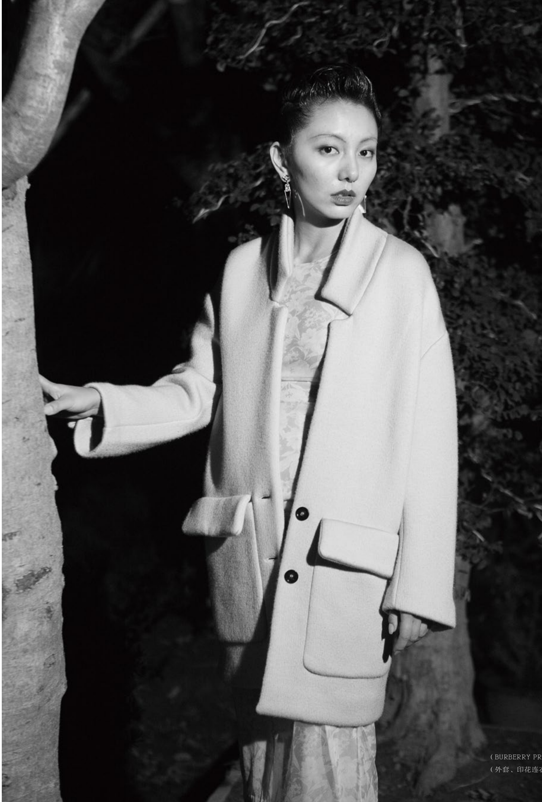
(BURBERRY PRORSUM) (外套、印花连衣裙)