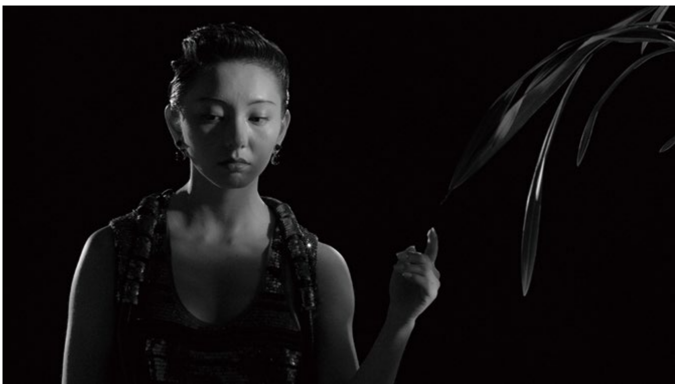
( GIVENCHY BY RICCARDO TISCI ) ( 亮片礼服裙、耳环 )