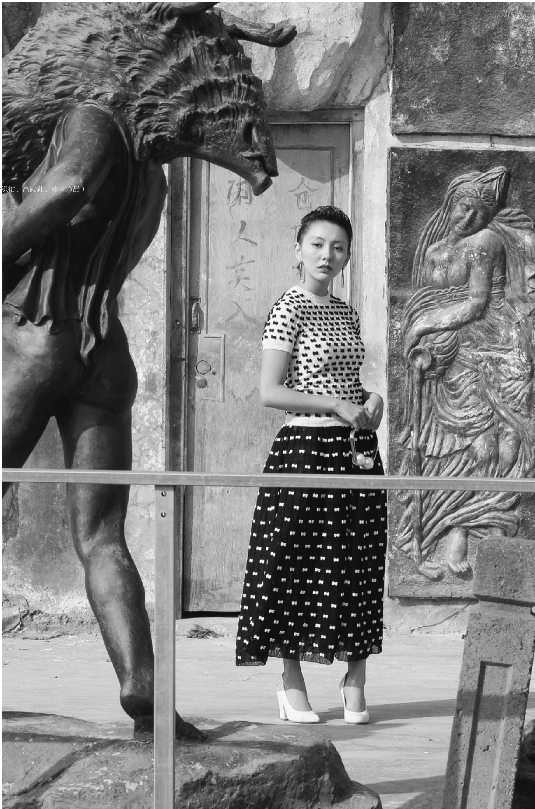
(CHANEL) (针织短袖、针织裙、高跟鞋、珍珠饰品)