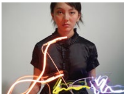
《将军的微笑》 (多屏录像装置) 2009

杨福东与《周末画报》联合创作的影像作品《被遗忘的蝴蝶结》延续了艺术家自一年前启动的长期电影计划：《关于与一切未知的女孩：马斯瑟》。这部极具创作野心的作品，关乎一个女孩生活中的一切，关乎她生命中未来的未知的种种可能。一切围绕“未知”而行进。杨福东任由时间和情感引导着创作的脉络，他等待着未知的驾临。等待着一切未发生的，或曾被遗忘的，进入他的视野。